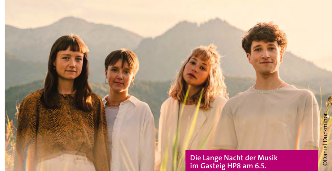
Schätzen es ruhig, gemütlich und gerne auch mal grün: The Komets