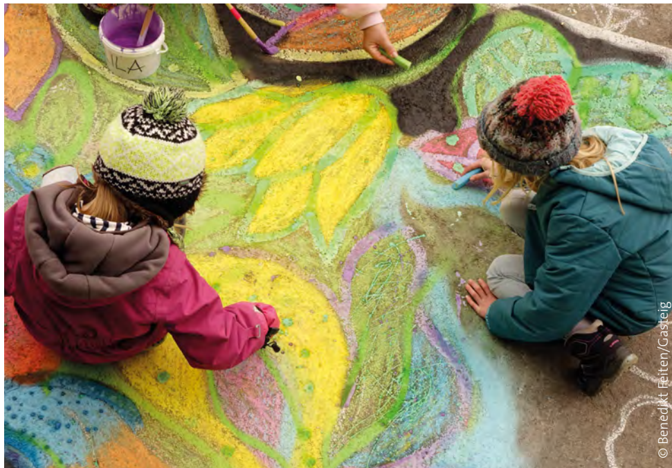
Gemeinsam machen wir den Gasteig bunter! Bei „Pflanz den Gasteig!“ entsteht vor der Halle E ein buntes Kreide-Mandala.

Und weil der Gasteig HP8 heuer mit ganz München Kunst und Kultur rund um die Blüte feiert und noch bis Oktober das Flower-Power-Festivalzentrum ist, findet hier am Samstag, den 13. Mai zum Abschluss der diesjährigen Pflanzentauschbörse ein grüner Aktionstag für alle statt.