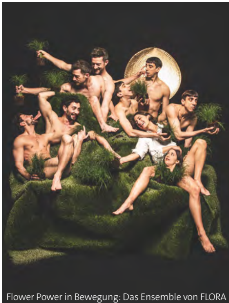
Flower Power in Bewegung: Das Ensemble von FLORA

Seine Tanzperformance FLORA ist eines der Highlights des Flower Power Festivals im Gasteig HP8. Am 16. und 17.5. präsentiert der italienische Tänzer und Choreograf sein neues Stück in der Halle E im Gasteig HP8. Erkundet wird dabei die Welt der Pflanzen. FLORA nimmt uns mit auf eine Reise in unterirdische Räume, in denen es keine Hierarchien gibt. Hier funktioniert Kommunikation anders, als wir Menschen sie kennen.