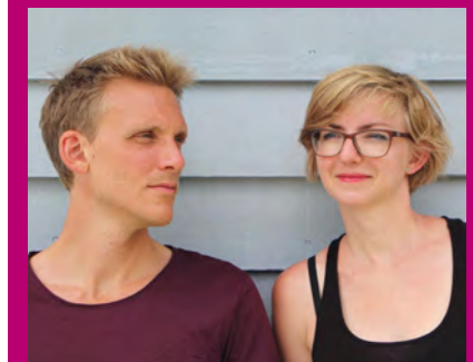
Untermalen einen entspannten Tag auf der Kulturinsel: das Duo SOYL (Soundtrack Of Your Life)

Großes Maifest zum Abschluss der Pflanzentauschbörse mit Musik und Mitmach-Aktionen