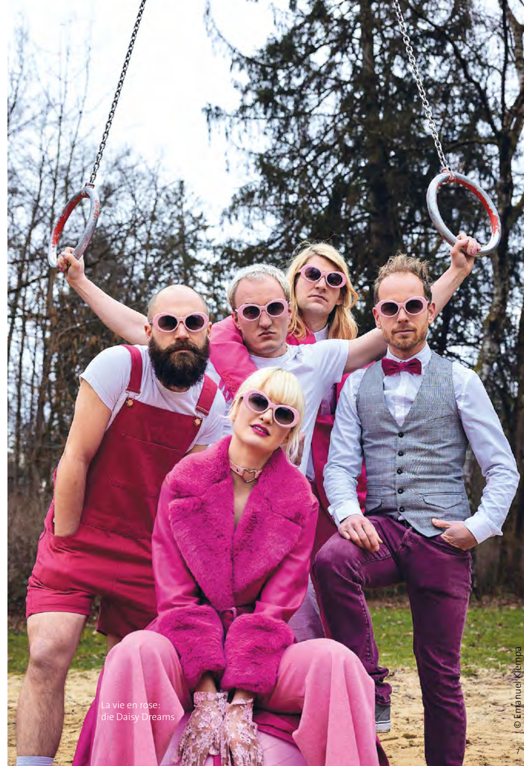
La vie en rose: die Daisy Dreams

Johnny & the Yooahoos: „Zu der Zeit waren unsere zwei absoluten Lieblingsbands aktiv: Creedence Clearwater Revival, die ja auch in Woodstock aufgetreten sind, und die Beatles natürlich, die uns nach wie vor sehr inspirieren.“ Überschneidungen gibt es zuhauf.