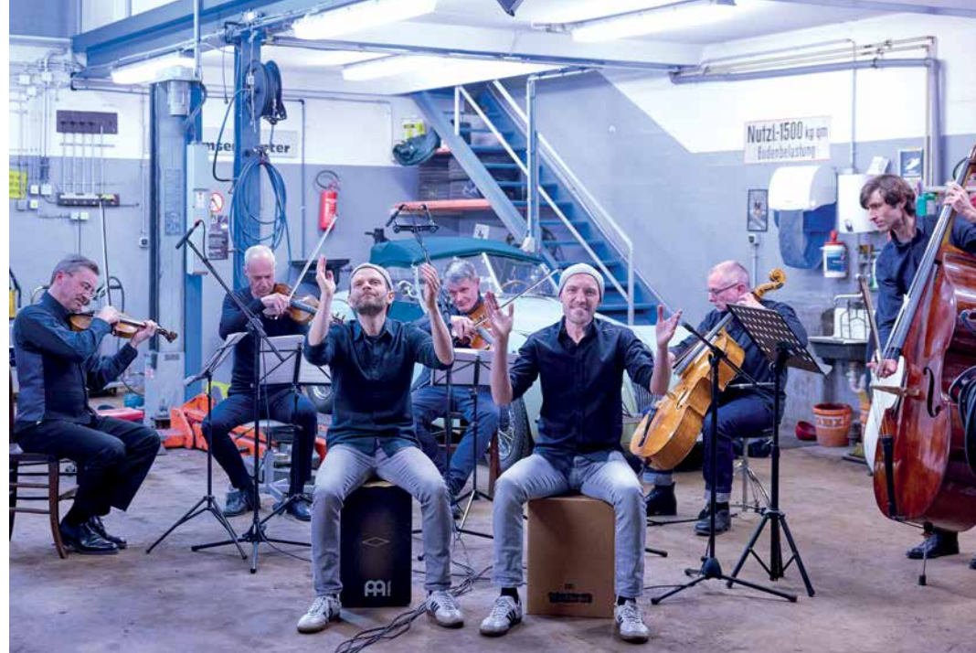
Double Drums bei einer Session mit dem Münchener Kammerorchester (MKO) in der benachbarten Autowerkstatt im HP8. Das Video gibt's auf Instagram: @mko_muenchen

Ja, wir wollen gemeinsam mit dem Münchener Kammerorchester (MKO) ein Kinderkonzert in der Isarphilharmonie geben, voraussichtlich im