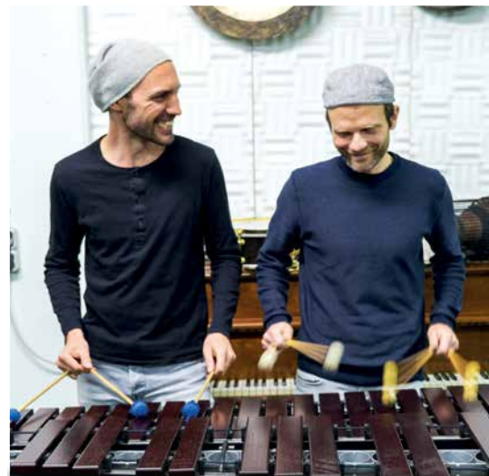
Die kreative Nachbarschaft im HP8: Double Drums am Xylophon 6