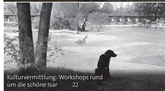
Kulturvermittlung: Workshops rund um die schöne Isar 22