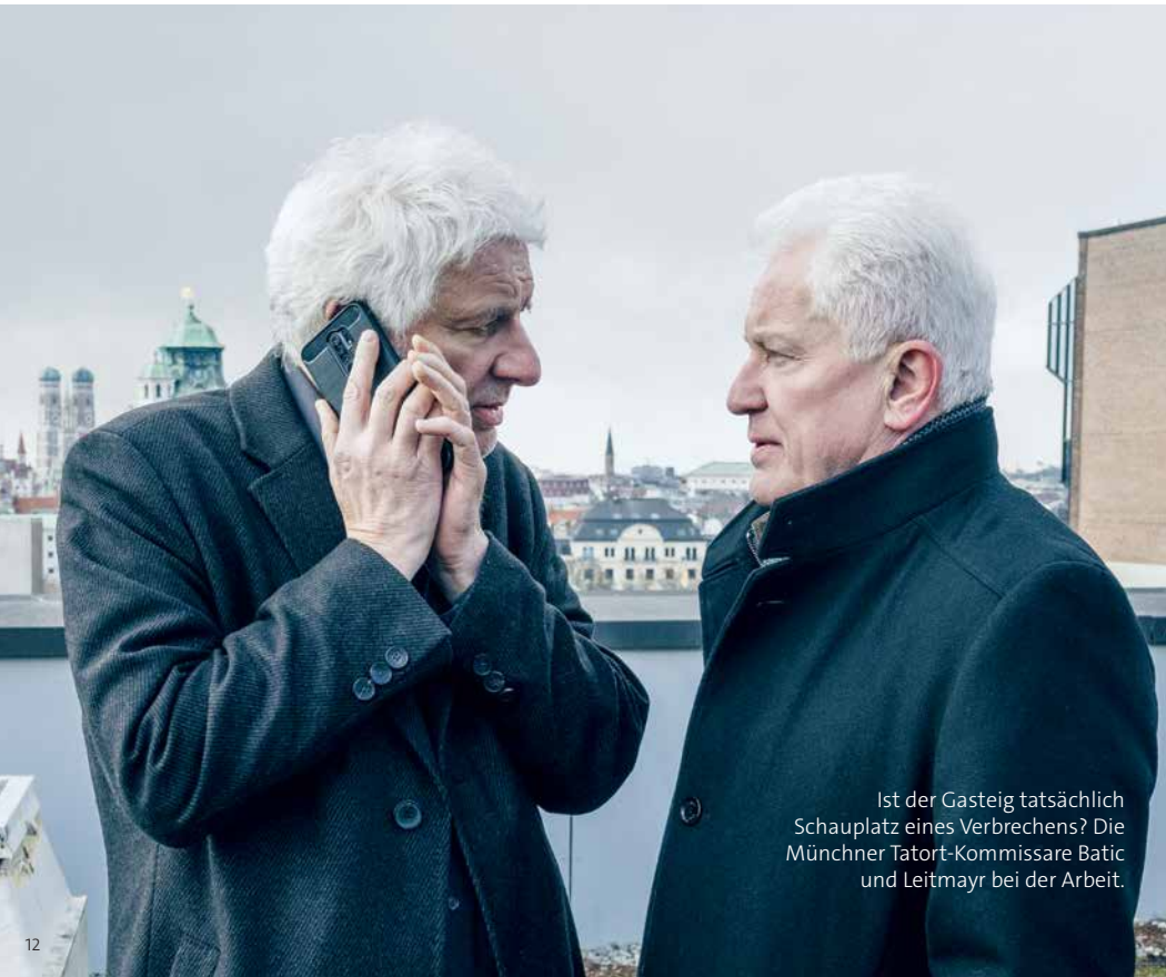
Ist der Gasteig tatsächlich Schauplatz eines Verbrechens? Die Münchner Tatort-Kommissare Batic und Leitmayr bei der Arbeit.

Mörderisch gute Nachrichten für Krimi- und Kulturfans: Im Herbst kommt ein neuer Münchner Tatort ins Fernsehen. Schauplatz des Verbrechens ist nach über 30 Münchner Tatort-Jahren zum ersten Mal der Gasteig. Den erfolgreichen Ermittlungen sicher dienlich: Die beiden Kommissare Batic (Miroslav Nemec) und Leitmayr (Udo Wachtveitl) sind als Künstler und privat schon länger mit Münchens Kulturzentrum und seinen Bühnen vertraut. Vor der Ausstrahlung stellen sie sich dem Gasteig-Verhör.