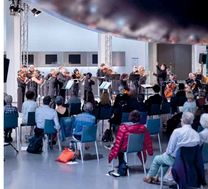
8 Ein ganz besonderes Orchester: Lernen Sie die vielen Seiten des MKO kennen!