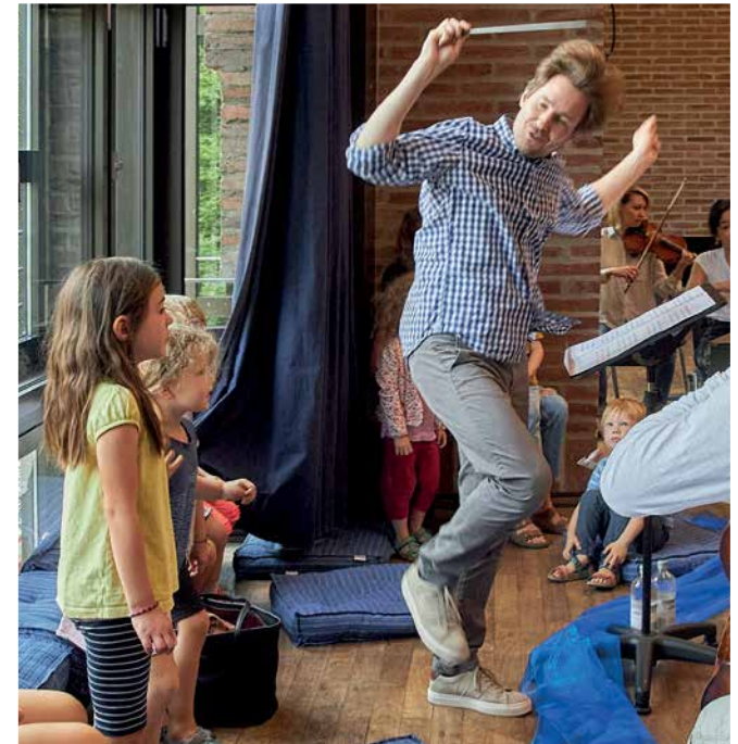
15 Das MKO möchte alle für Musik begeistern, z. B. beim Kinderkonzert in der Isarphilharmonie.