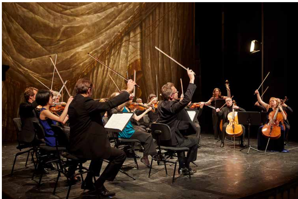
Das MKO ist unterwegs auf vielen Bühnen: hier beim Konzert im Münchner Cuvilliéstheater