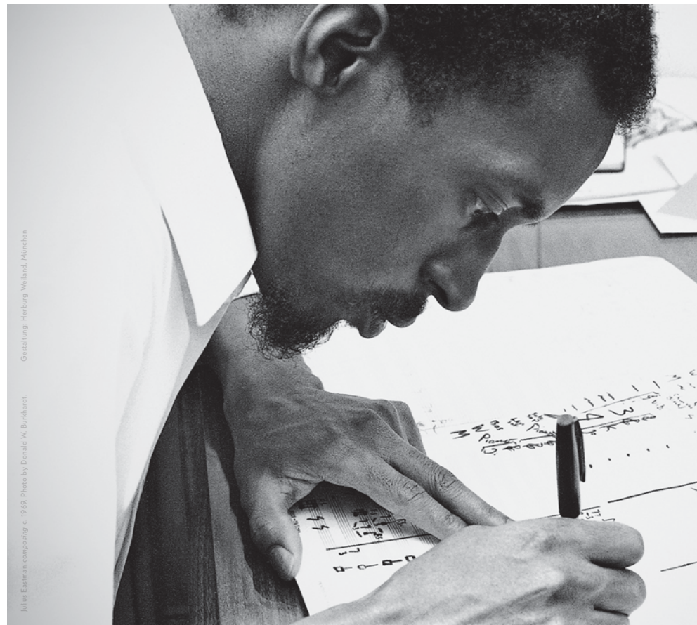
Julius Eastman composing c. 1969.

ISARPHILHARMONIE | GASTEIG HP8 20:00 Uhr | € 57,80 bis € 149,80