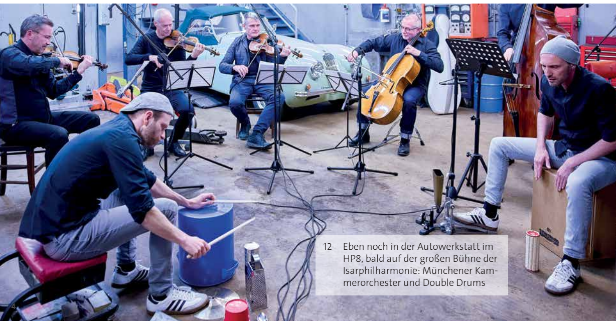
12 Eben noch in der Autowerkstatt im HP8, bald auf der großen Bühne der Isarphilharmonie: Münchener Kammerorchester und Double Drums