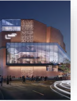
Der neue Gasteig